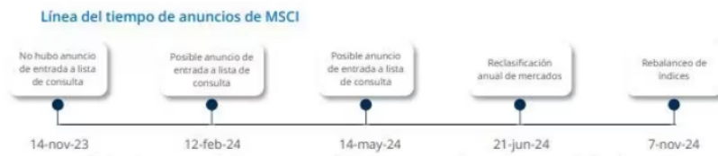
Línea del tiempo de anuncios de MSCI

En Alianza señalan que en la lista de la cuerda floja para salir de emergente a frontera están también Perú, República Checa y Egipto.