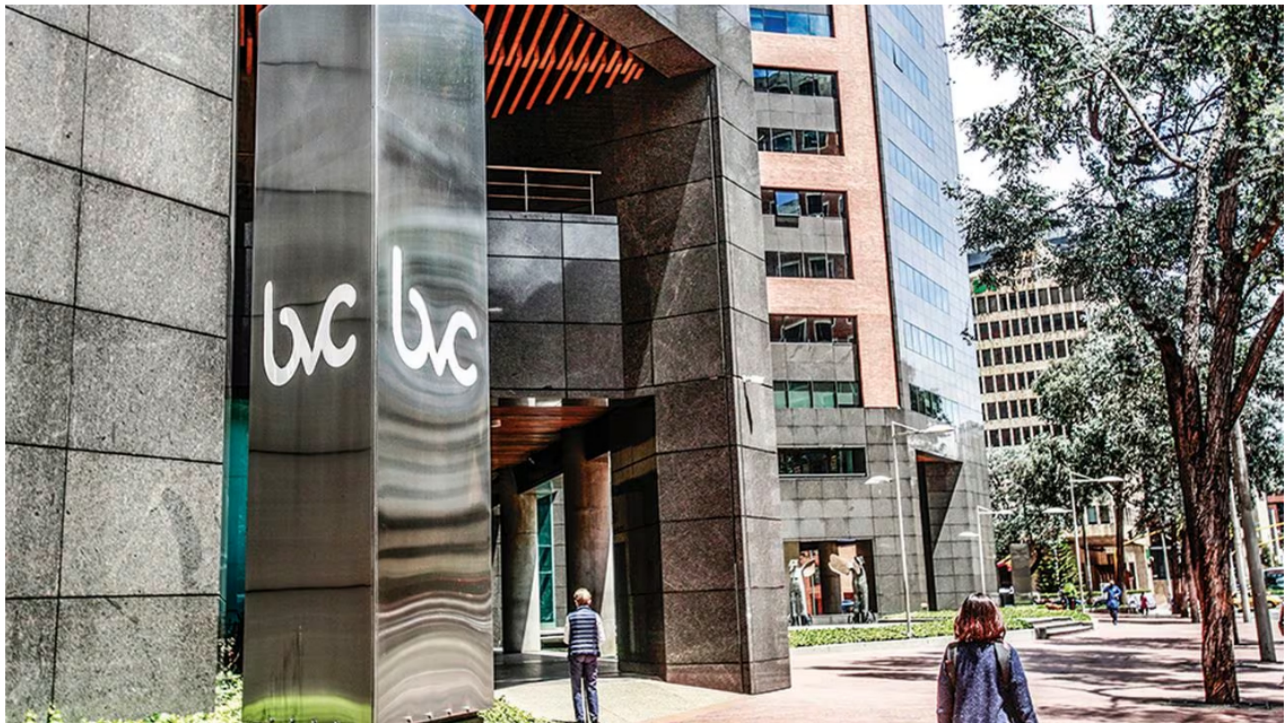
Las acciones colombianas son hoy las únicas en terreno negativo entre sus pares latinoamericanas.

En medio de las preocupaciones que ha generado el dato de crecimiento del tercer trimestre del 2023, cuando el PIB se contrajo un 0,3 %, se conoció una noticia positiva para el país.