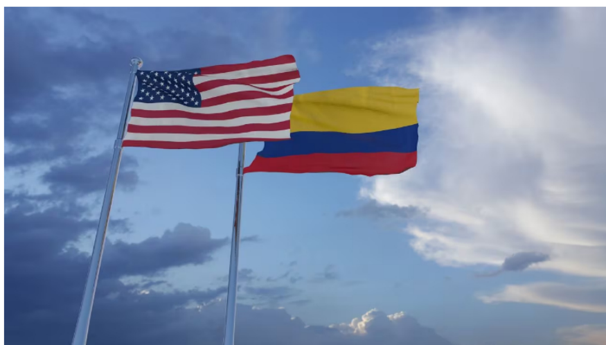
El petróleo WTI es uno de los más importantes en Estados Unidos.

La que menos cae es la acción del Grupo de Energía de Bogotá, que cae un 0,29 %, con un precio por acción de 1.725,00.