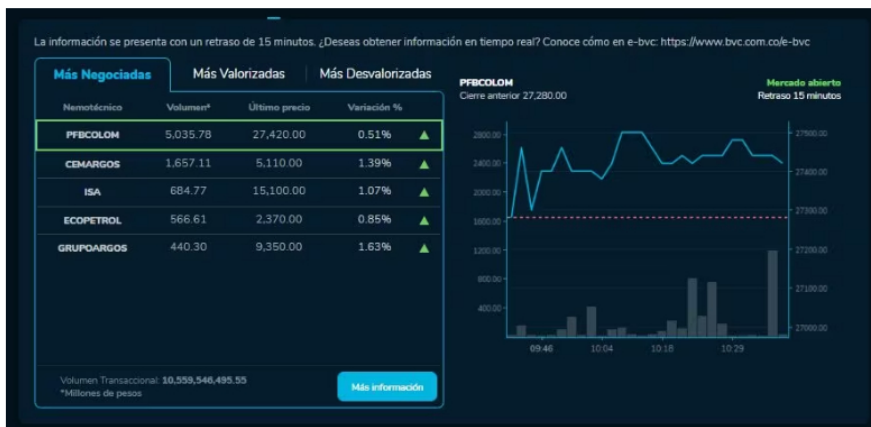
Así amanecieron las acciones de las empresas en la BVC durante este 14 de noviembre.

Respecto a las acciones con mejor repunte, la de Terpel es la que encabeza la lista, con una subida de 2,74 % y un último precio por acción de 6.750,00. Le sigue la acción de Corficolombiana (CORFICOLCF), que tuvo una variación positiva de 1,92 % y un último precio por acción de 12.760,00.