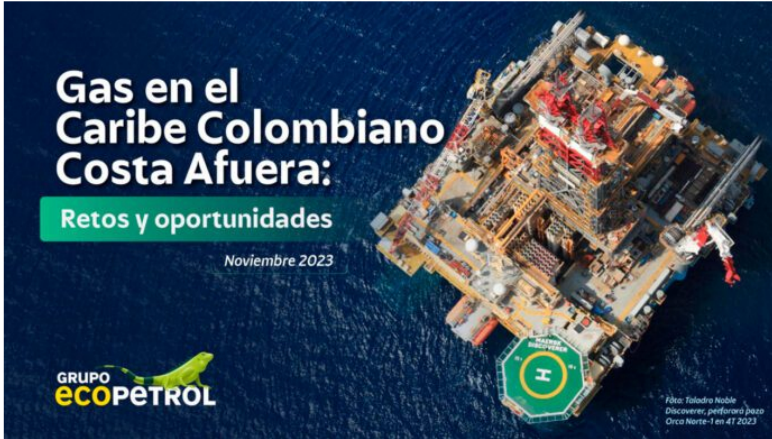
Alrededor de dos meses y medio durarán los trabajos de perforación de pozo delimitador Orca Norte-1, de Ecopetrol, en el Caribe colombiano.

La importancia del pozo delimitador Orca Norte-1 es que es el primer hito operado 100% por la estatal petrolera para comprobar el potencial de las reservas de gas.