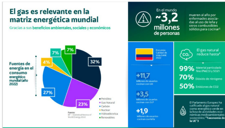
El gas es relevante en la matriz energética mundial