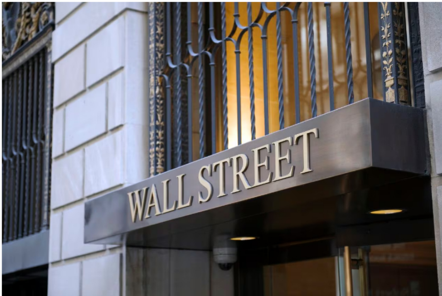
Entre los valores del día, Nvidia (+2,95%), AMD (+4,49%) e Intel (+2,80%) subieron.

Los índices reaccionaron favorablemente a la confirmación de un encuentro entre el presidente Joe Biden y su par chino, Xi Jinping, el miércoles próximo en San Francisco, al margen de la cumbre de la APEC.