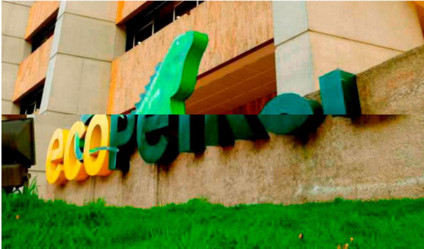
Ecopetrol transferirá hasta $8 billones menos en 2024.

Menos dividendos y posibles golpes a la tributaria de Petro afectarían y harían eco en el Presupuesto 2024