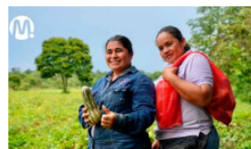
Campesinos del Meta vendieron toneladas de alimentos a Ecopetrol