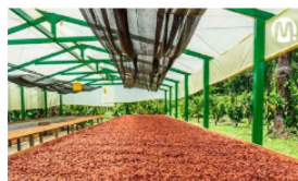
En operación nuevas centrales de beneficio de cacao en el Meta