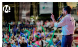
Construir 20.000 soluciones de vivienda: la meta de Wilmar Barbosa