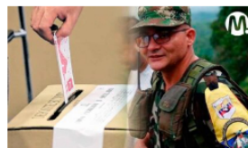
No hay garantías electorales en 'zonas rojas': denuncia gobernador del Meta