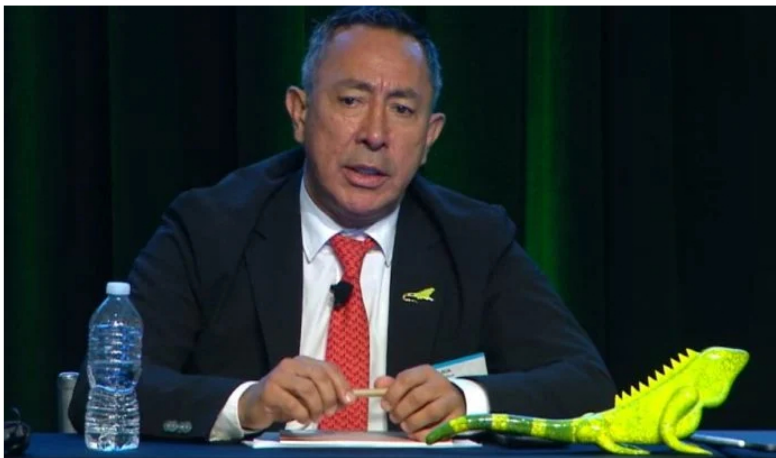
Ecopetrol convocará en 2023 Asamblea Extraordinaria para cambiar estatutos y miembros de la Junta.

Síguenos en nuestro canal de noticias de WhatsApp