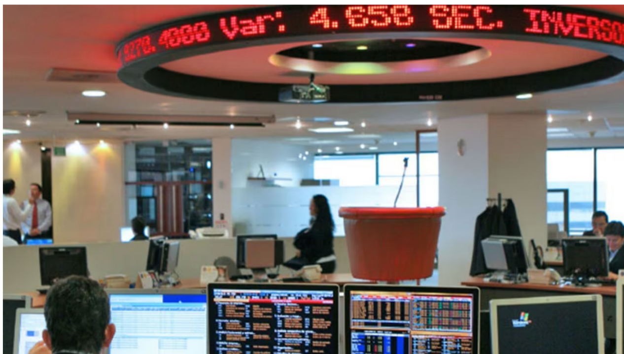
Son varias las acciones que hoy repuntan en la BVC. Cementos Argos, Ecopetrol y más.

La jornada de este miércoles 8 de noviembre en la Bolsa de Valores de Colombia arrancó con números verdes y un panorama que genera mayor optimismo para los inversionistas que transan en este mercado. La acción de Ecopetrol, la petrolera más importante del país, abrió al alza pese a a la más reciente revelación de la abismal caída en las utilidades de la petrolera, que fue de 46,5 %.