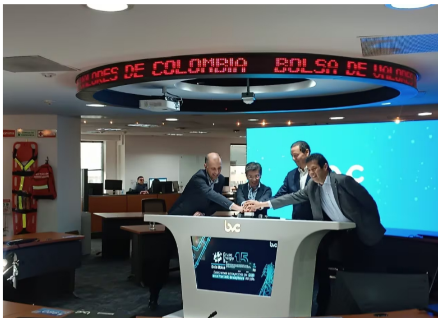
La alcaldesa Claudia López lideró un acto simbólico para tocar la campana del escenario bursátil.

En cuanto a las acciones que más pierden valor en la BVC, la única que registra un comportamiento a la baja es la de Mineros, que tiene una variación del 0,28% y se ubica en un último precio de 1.770,00.