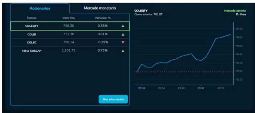
Cómo amanecieron los índices bursátiles el 8 de Noviembre. MSCI COLCAP, COLSC, entre otros.

El único índice que cae entre los analizados es el COLSC, que hoy tiene una variación negativa del 0,29 % y un valor hoy de 786.14. Es preciso recordar que este índice es uno de los que mejor tolera el riesgo y que tiene un retorno más alto en el portafolio, pues compara las 15 empresas más pequeñas en capitalización bursátil.