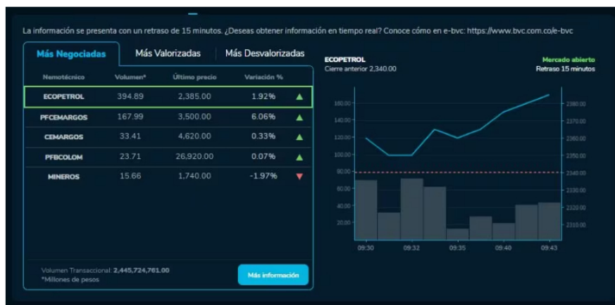
Así amanecieron las acciones de las empresas en la BVC durante este 8 de Noviembre.

Finalmente, se encuentra detrás la acción preferencial de Bancolombia, con un volumen del 23.71. La última en el top 5 es la acción de Mineros, que registra hoy un volumen de 15.66.