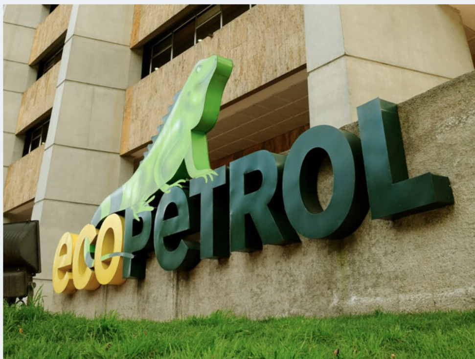
Sede de Ecopetrol.