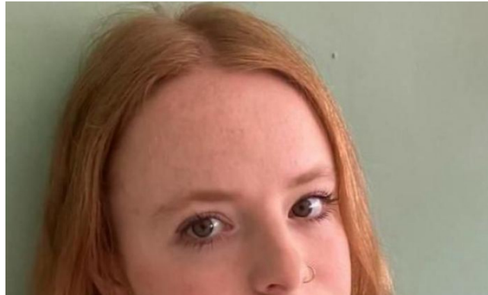
Las ganancias de Ecopetrol de Colombia se desploman a medida que crece la producción de petróleo

BOGOTÁ, 7 nov (Reuters) – La petrolera mayoritariamente estatal de Colombia, Ecopetrol (ECO.CN), registró el martes una caída del 47% en su beneficio neto del tercer trimestre, en comparación con las ganancias del mismo periodo del año anterior, debido a que los precios del crudo se quedaron rezagados, por detrás de los máximos de 2022, pero la producción siguió creciendo.