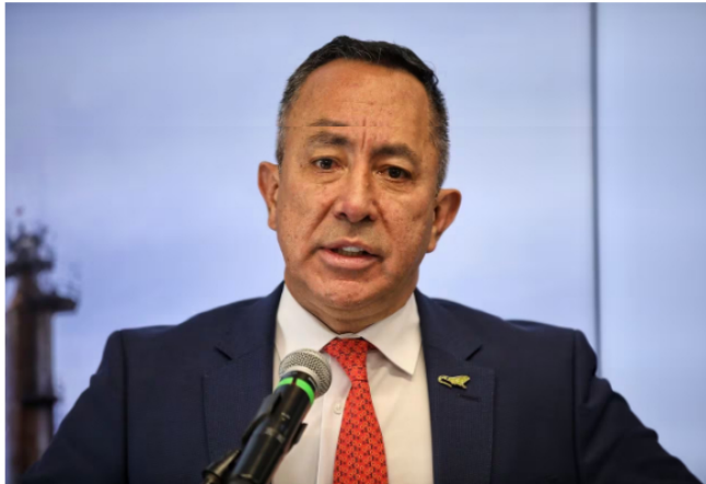
Ricardo Roa Barragán, presidente de Ecopetrol.

Por su parte, el presidente de Ecopetrol, Ricardo Roa, en el informe del tercer trimestre de 2023 señaló que la producción registrada en el periodo reportado sería la mayor desde el 4 trimestre de 2015.