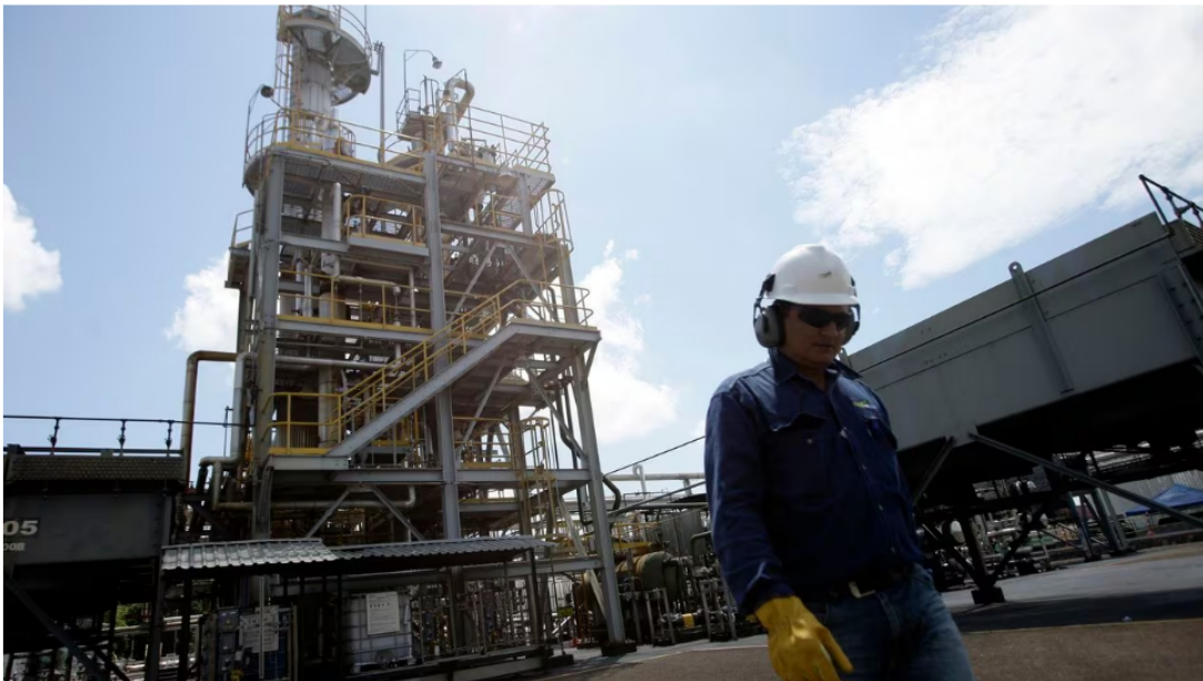
Ecopetrol presentó sus resultados económicos este martes.

7 de noviembre de 2023 Por: Redacción El País