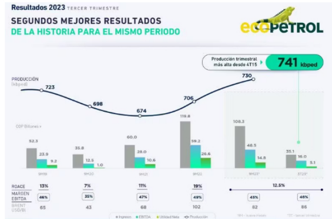
Resultados de Ecopetrol en el Tercer Trimestre de 2023 | Foto: Ecopetrol

Según el documento presentado, en el acumulado del año Ecopetrol registró ingresos consolidados por $ 108 billones y una utilidad neta de $ 15 billones.