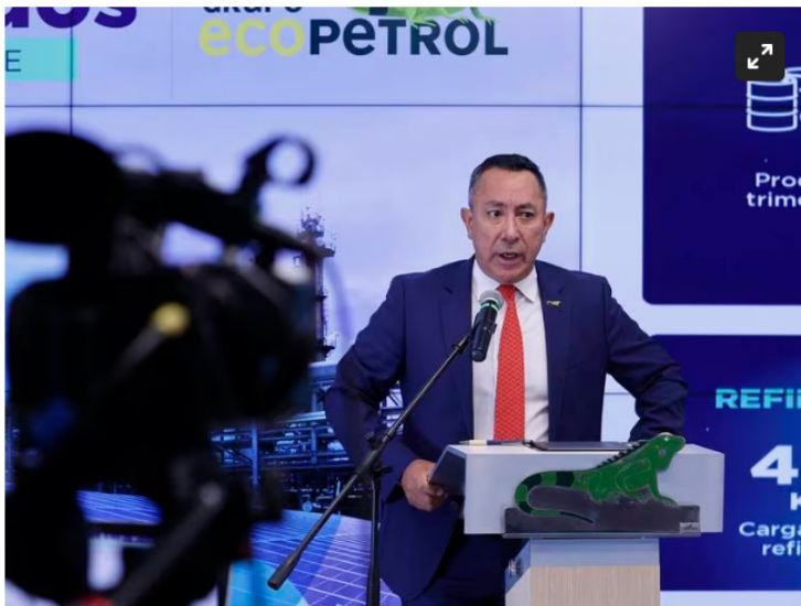
AME9136. BOGOTÁ (COLOMBIA), 08/08/2023.- Ricardo Roa, presidente de Ecopetrol y exgerente de la campaña presidencial de Gustavo Petro, habla durante la presentación de resultados financieros y operativos del segundo trimestre de 2023, hoy en Bogotá (Colombia).

En el periodo julio-septiembre las ganancias de la compañía ascendieron a $ 5.1 billones