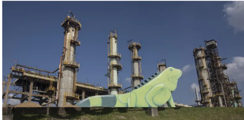
Utilidades de Ecopetrol caen 44% hasta septiembre y las ventas bajan 9,6%

■ Al cierre del tercer trimestre ganó $14,8 billones, mientras que un año atrás sus utilidades fueron por $26,5 billones. Los ingresos de la petrolera terminaron el noveno mes en $108 billones