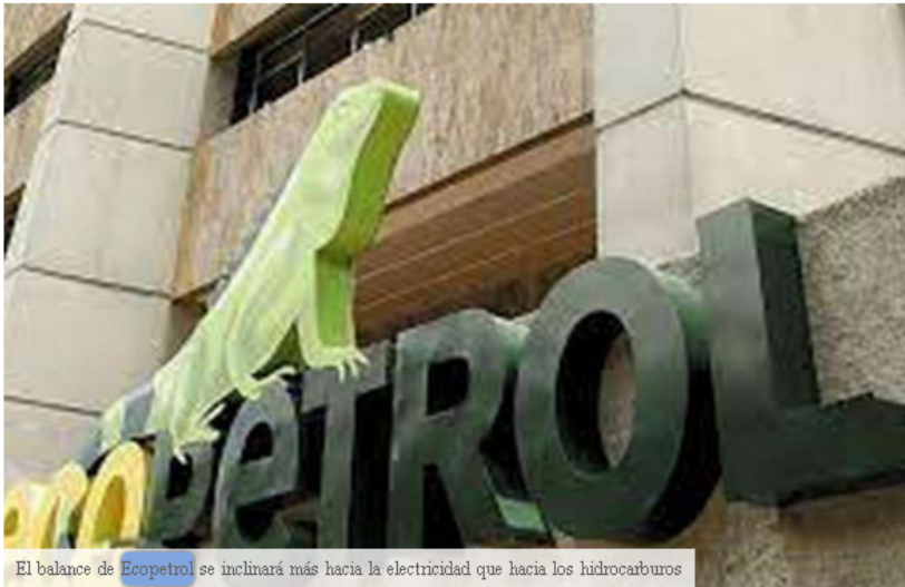
El balance de Ecopetrol se inclinará más hacia la electricidad que hacia los hidrocarburos

Ecopetrol se centrará más en la generación eléctrica.