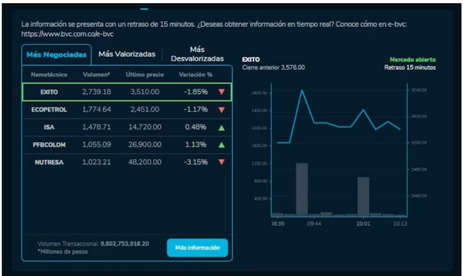
Así amanecieron las acciones de las empresas en la BVC durante este 3 de Noviembre

Respecto a las empresas que ganan más valor en el mercado, la acción de preferencial de Bancolombia (PFBCOLOM) es la que más se revalúa, con una variación del 1,13% y un último precio de 26.900,00. A esta le sigue la acción preferencial de Cementos Argos (PFCEMARGOS), que crece hoy un 0,66% y un último precio de 3.372,00.