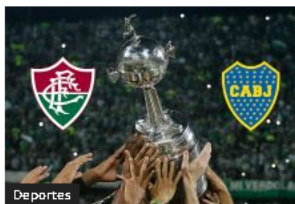
Fluminense y Boca definen quién será el Rey de América