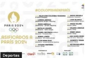
Colombia suma 33 cupos olímpicos para París 2024 con destacadas actuaciones