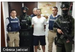
Alias «Satanás» confiesa sus crímenes pero busca un acuerdo con la Fiscalía