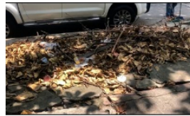
Comunidad busca solución por acumulación de residuos

En Medellín está el primer barrio que tiene energía con paneles solares