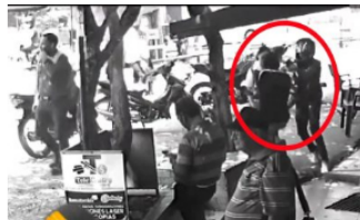
Imágenes revelan al presunto autor del homicidio en D1 de Barrancabermeja