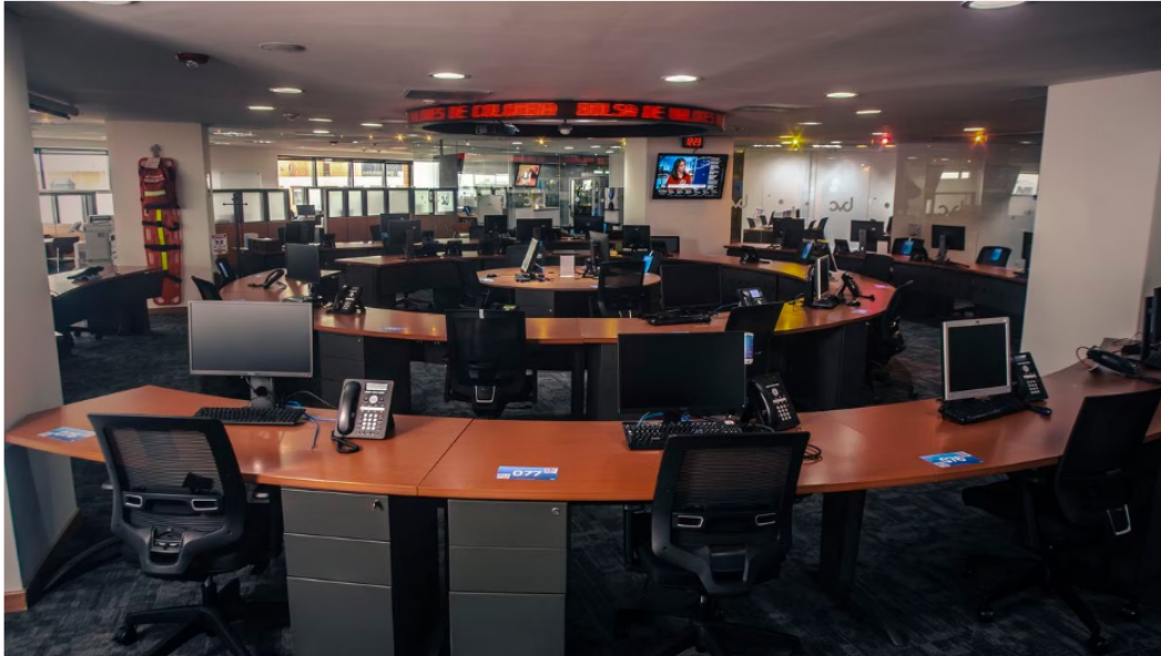
Esta no ha sido una buena semana para la Bolsa de Valores de Colombia.

La Bolsa de Valores de Colombia y Ecopetrol se hundieron una vez más este martes -30 de mayo- tras un arranque poco favorable para el mercado y se alistan para despedir un mes más con números en rojo, en medio del ambiente de incertidumbre y expectativa que hay entre los inversionistas por lo que se vendrá en el arranque de junio en materia de inflación, reformas y tasas de interés, así como desde Estados Unidos con las votaciones en el Congreso para elevar el techo de deuda de ese país y evitar un default que afecte a una de las economías más fuertes del mundo.