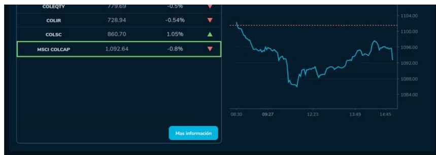
De acuerdo con los registros de cierre para esta oportunidad, el índice MSCI Colcap acabó en 1.092,64 unidades, cediendo de esta forma un -0,8 % respecto a las 1.101 que marcaron la referencia.

Con esto no solo se rompe la buena racha, sino que se borran de tajo los buenos resultados que había logrado el pasado lunes, cuando acabó en 1.101,47 unidades, tras crecer apenas un 0,05 % con respecto a las 1.100 que marcaron la referencia. La volatilidad prueba de que los ánimos entre los inversores no pasan por su mejor momento, sigue jugando en contra del buen desempeño de este indicador, uno de los más importantes para saber qué está pasando con el mercado bursátil local.