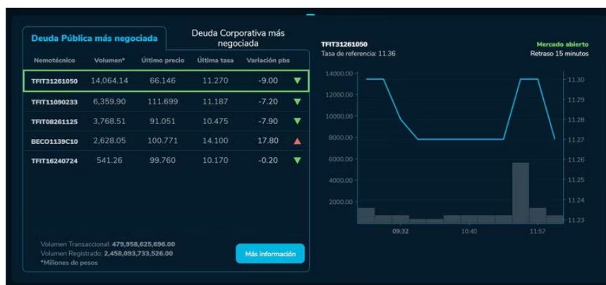
En lo que concierne a los mercados de renta fija, por ahora gran parte de los indicadores se mantienen con registros positivos.

Una de las noticias del día en el mundo económico tiene que ver con la confianza de los consumidores en la economía de Estados Unidos, que cayó en mayo nuevamente, aunque menos de lo esperado, pero a un mínimo desde noviembre, según el índice del Conference Board publicado el martes.