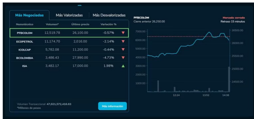
El Congreso de Estados Unidos se apresura este martes a examinar un acuerdo alcanzado por el presidente Joe Biden y el republicano Kevin McCarthy, en una carrera contrarreloj para evitar un catastrófico default.

Al cierre del día se tiene prevista una primera reunión crucial del Comité de Reglas de la Cámara. El encuentro será un termómetro del equilibrio de fuerzas, puesto que el ala más izquierdista de los demócratas y los republicanos más a la derecha se oponen al acuerdo bipartidista alcanzado el fin de semana.