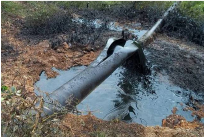
Este es el octavo ataque del que es objeto este tramo en lo que va del 2023

Este martes 30 de mayo, en la vereda La Pava, en zona rural del municipio de Saravena (Arauca), el oleoducto Caño Limón Coveñas, una de las vías más importantes en el transporte de crudo de Colombia, sufrió durante la tarde un nuevo atentado contra su estructura . Además, se informó que este sector es donde tienen injerencia las tropas del Ejército de Liberación Nacional (ELN) .