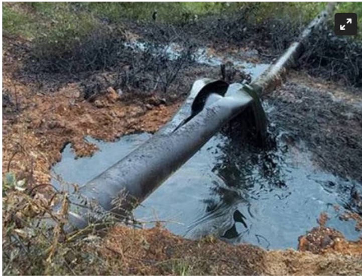
Oleoducto Caño Limón Coveñas

En la zona delinquen estructuras de las disidencias FARC y el ELN.