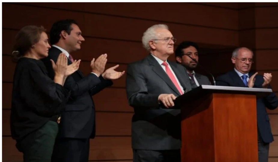
ExminHacienda se pronuncia sobre retos para Bonilla.

Por Sergio Rodríguez - Líder SEO · 2023-05-29