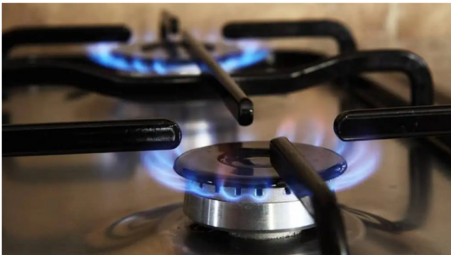
CdO hizo varias recomendaciones a sus usuarios para hacer frente a la restricción del gas natural en el suroccidente de Colombia.

Apuntó el exministro Ocampo para que el ministro de Hacienda, Ricardo Bonilla, el Ministerio de Comercio y Ecopetrol en su conjunto se sienten y definan las bases sobre la necesidad de que, con el reciente informe de reservas de petróleo y gas en Colombia, se construya un plan de nueva exploración.