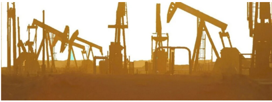
Producción de petróleo.

Dijo Ocampo, en entrevista con Bloomberg, que los nuevos datos que muestran una caída en el número de años de reservas de petróleo y gas obligan a un viraje sobre los proyectos futuros.