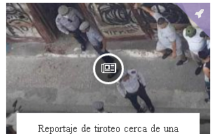
Reportaje de tiroteo cerca de una escuela en Centro Habana - .