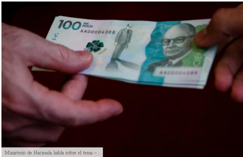
Ministerio de Hacienda habla sobre el tema - .

El ministro de Hacienda, Ricardo Bonilla, dijo que no se contempla importar gas de Venezuela. “No tenemos riesgo de importar gas de Venezuela (...) hemos encontrado gas costa afuera y en el Caribe y está en fase de evaluación”, dijo el funcionario.