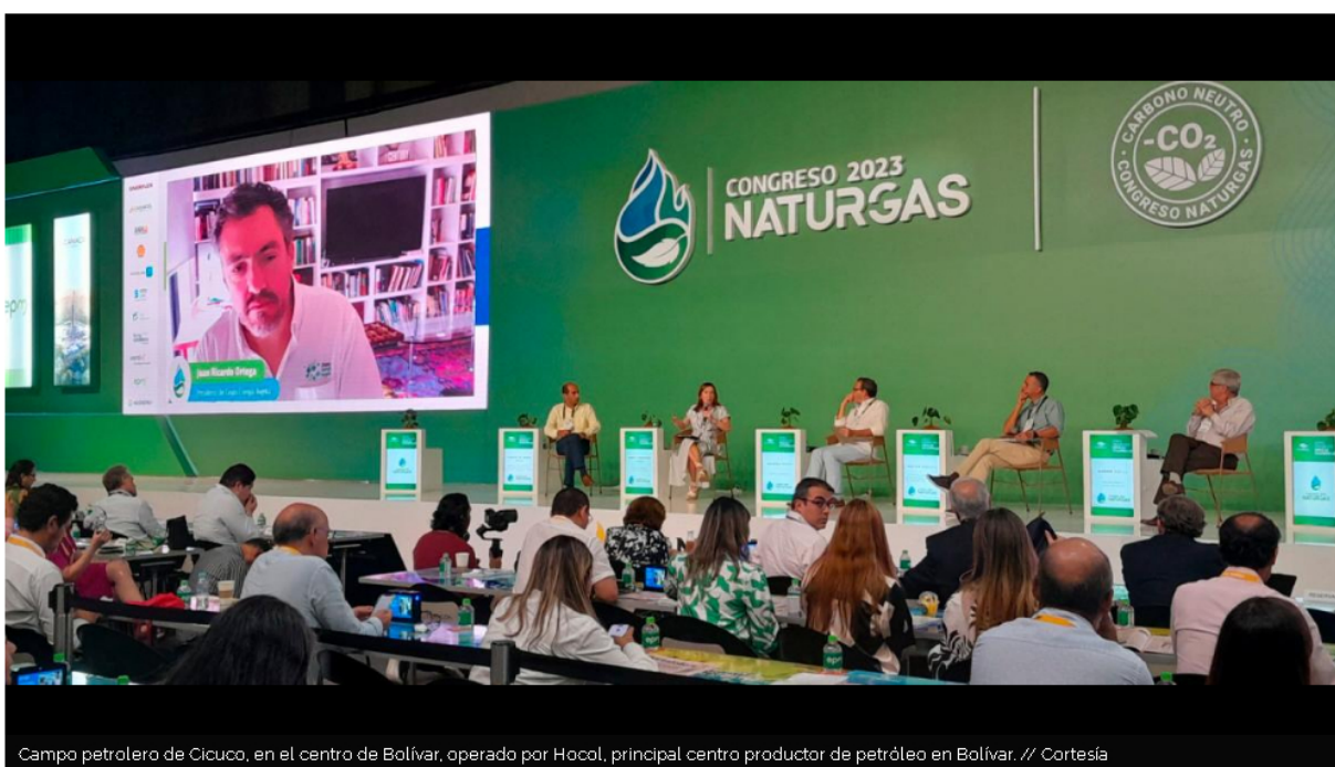
Campo petrolero de Cicuco, en el centro de Bolívar, operado por Hocol, principal centro productor de petróleo en Bolívar.

Conozca cuáles son los dos departamentos más productores de petróleo en Colombia y cuál es el aporte de Bolívar a las reservas totales del país.