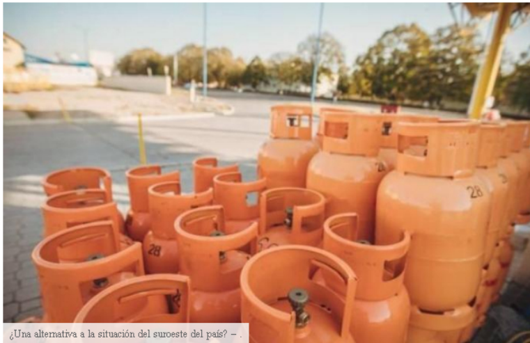
¿Una alternativa a la situación del suroeste del país? - .

Ante la suspensión del servicio público de gas natural domiciliario en el suroeste del país, los gremios de GLP (gas licuado de petróleo) Comúnmente conocidos como gas propano o gas cilíndrico, dicen que pueden ser una solución para evitar una crisis.