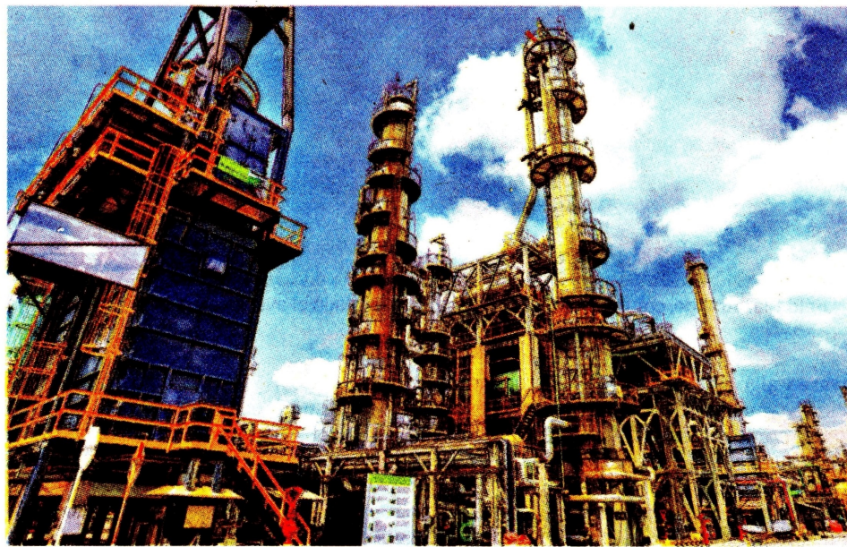
El Gobierno apunta a mantener el recobro mejorado.

Sin embargo, la jefe de la cartera señaló que continuarán con la política actual de "mayor eficiencia