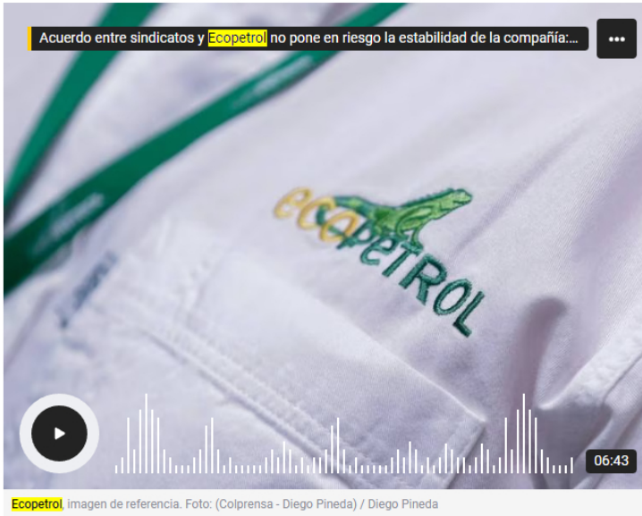
Ecopetrol imagen de referencia.

La USO aseguró que en la negociación de la nueva Convención Colectiva del Trabajo, se pidió que Ecopetrol mantenga la naturaleza de su negocio.