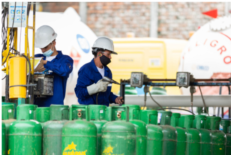
Las compañías de Gas LP están trabajando con Ecopetrol , para abastecer con las cantidades de gas propano que se requieren para atender a los departamentos afectados por la interrupción del servicio de gas natural.

Debido a la suspensión del servicio público domiciliario de gas natural en el Eje Cafetero, Valle del Cauca y algunos municipios del Cauca por causas generadas en el volcán Cerro Bravo, las compañías distribuidoras de Gas LP (GLP, comúnmente conocido como gas en pipeta) trabajan en disminuir el impacto de la crisis de abastecimiento de gas natural.