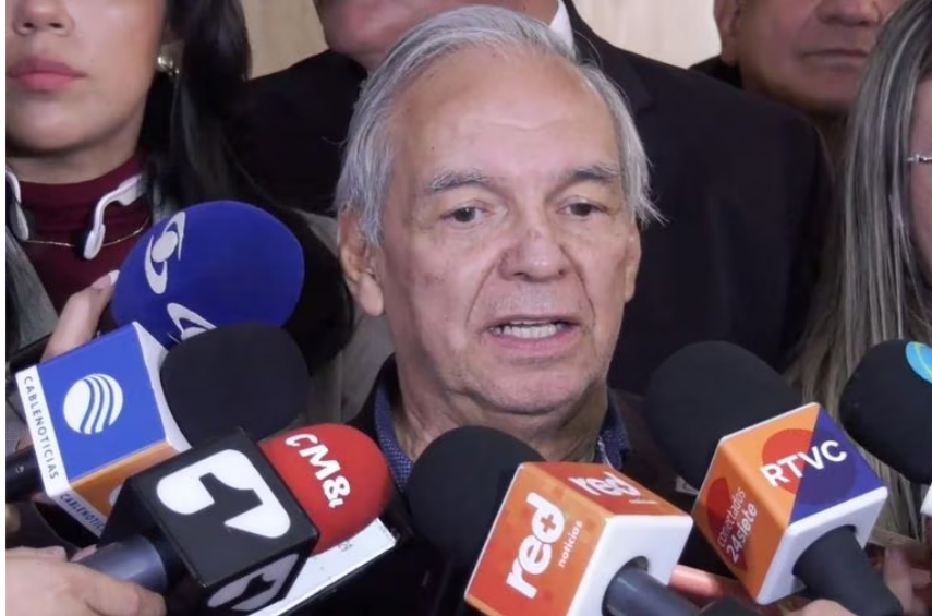
Ricardo Bonilla, ministro de Hacienda.

“ Ecopetrol tiene que irse preparando para convertirse en la empresa energética del país. Que no solo hable de petróleo y gas, sino que también hable de energía solar y eólica. Eso no significa que se convierta en el monopolizador del sector energético”, comentó Bonilla.