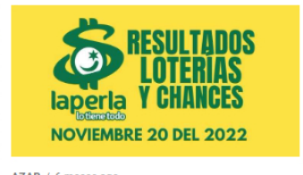
AZAR / 6 meses ago Resultados de loterías y chances el día 20 de Noviembre