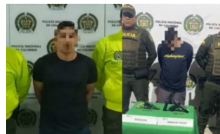
JUDICIAL / 3 meses ago Estos son los Capturados presuntos responsables del homicidio de niña de 13 años