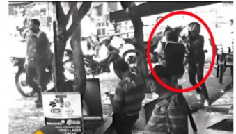
ACTUALIDAD / 3 meses ago Impactante video del ataque sicarial en el corregimiento El Centro