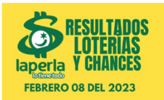
AZAR / 3 meses ago Resultados de chances y loterías del 8 de febrero del 2023