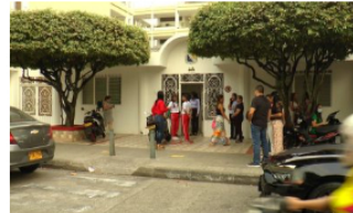
JUDICIAL / 3 meses ago Muere una niña de 15 años al ingresar al colegio Bethlemitas