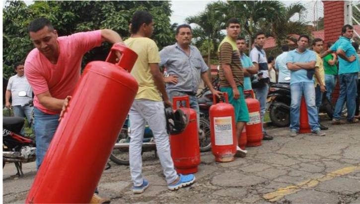
Gas propano únicamente para uso domiciliario

“Esta crisis pone de presente que el GLP es una alternativa energética importante para los hogares, sector industrial y establecimientos comerciales, en la medida en que está disponible aún bajo las circunstancias más apremiantes”, afirmó Alejandro Martínez Villegas, presidente de Gasnova.