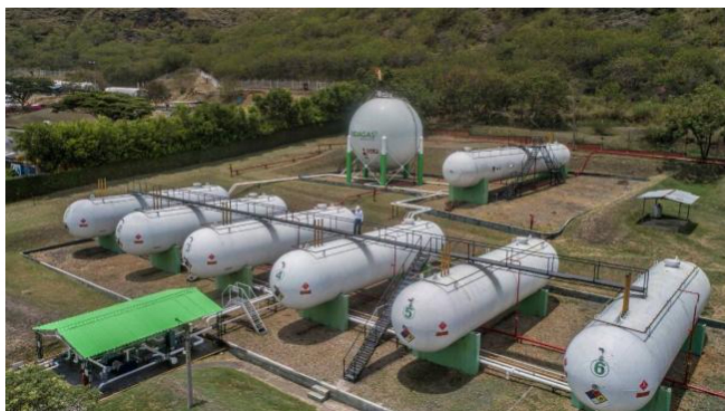
En la actualidad, el GLP presta el servicio público domiciliario en el 96 por ciento del país, a través de una red de más de 70 empresa

Por su parte, desde Agremgas dijeron que los actuales inventarios de GLP son suficientes para apoyar y garantizar la prestación del servicio público domiciliario en esta coyuntura de falla de suministro del gas natural. “Es importante hacer un llamado de tranquilidad a la población que sale a buscar suministro del energético. Las entregas de GLP en campos son normales actualmente por parte de Ecopetrol y la logística de la cadena es rápida y eficiente en suministro”, dijo la entidad.