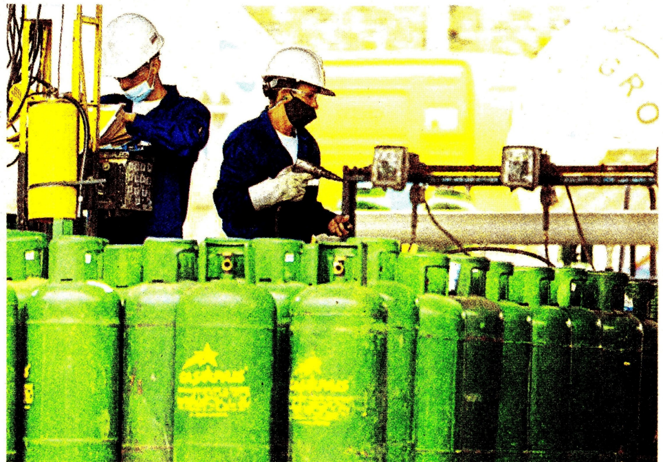
Hay dos millones de usuarios que no cuentan con el servicio público.