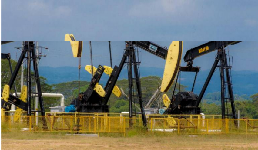
Sindicato de Ecopetrol alerta que en 10 días votará la huelga, y no por un tribunal de arbitramento.

Hoy termina la etapa de negociación directa entre sindicato y la petrolera.