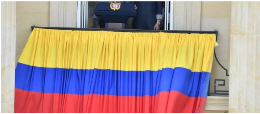
Presidente Petro habló de las reformas y la revolución en Colombia.

En ese sentido, el respeto por la institucionalidad y el cuidado de las finanzas debe seguir siendo el eje de la política macroeconómica. Lo anterior supone que el país pueda avanzar, por ejemplo, en cumplir las metas de la Regla Fiscal, al tiempo que se sanean las deudas del país.