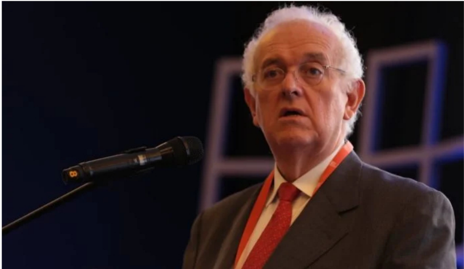
José Antonio Ocampo, ministro de Hacienda de Colombia, habla de la economía nacional.

Por Sergio Rodríguez - Líder SEO - 2023-05-13