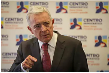
El expresidente Uribe señaló que en algunas regiones del país gobierna el narcotráfico Caracol Radio