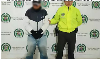
El siguiente artículo se está cargando . A prisión hombre que habría abusado de su suegra en el Putumayo Caracol Radio