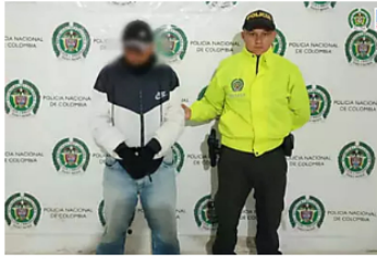
A prisión hombre que habría abusado de su suegra en el Putumayo Caracol Radio