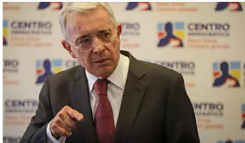
El expresidente Uribe señaló que en algunas regiones del país gobierna el narcotráfico Caracol Radio