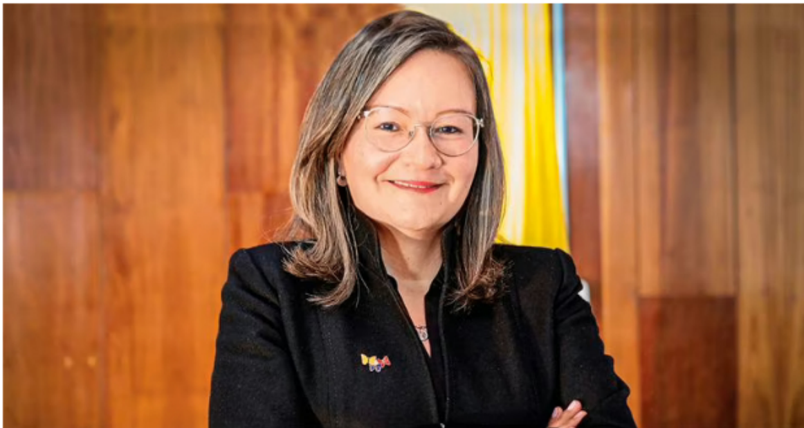
Cielo Rusinque, directora de Prosperidad Social (DPS).

Dijo que el contrato que citó al senadora para hacer los pagos del programa Colombia Mayor a través de SuperGiros es una orden de compra creado a través de la plataforma Colombia Compra Eficiente (CCE) y que no fue escogida a dedo como denunció Valencia.