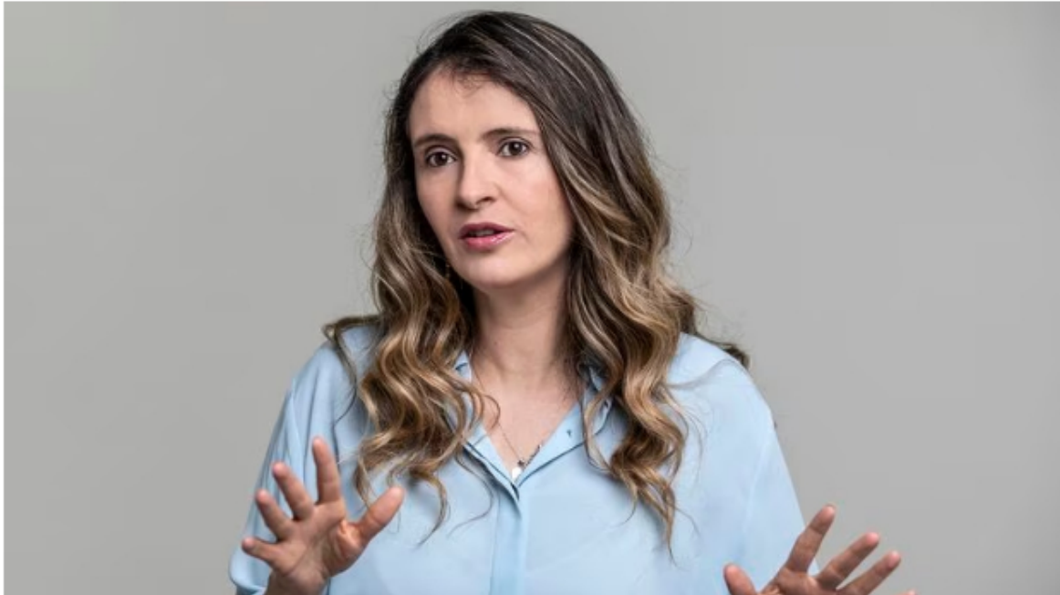
La senadora Paloma Valencia presentó las pruebas de su denuncia. Bogotá Septiembre 16 de 2021.