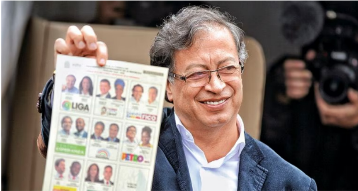
Supuestamente se hizo la alianza con SuperGiros para la campaña del presidente Gustavo Petro.

La senadora aseguró que la eficiencia del Banco Agrario no es la mejor y que se han presentado largas filas para el programa de renta ciudadana y Familias en Acción, en Boyacá y otras partes del país. Esto lo evidenció con videos ciudadanos que así lo denuncian.