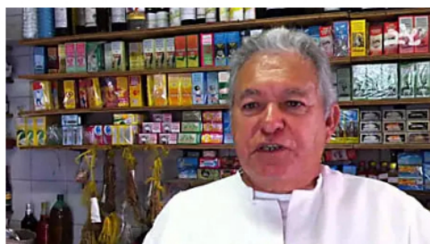
Ex diabético de Bogotá dice cómo mantener la