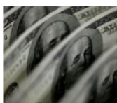
DÓLAR EN COLOMBIA Dólar en Colombia 11 de mayo de 2023

De igual manera, Roa también señaló que no respaldará un cambio en la fórmula para fijar los precios locales de los combustibles, en el caso de que se perjudicial para la empresa. Sus comentarios se producen tiempo después de que la ministra de Minas y Energía, Irene Vélez, anunciara que el Gobierno Nacional evaluaría la reducción de los precios de la gasolina en lugar de mantener una paridad con los precios internacionales.