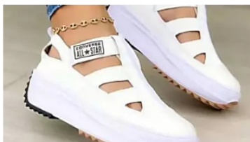
Alivia tu dolor de pies con los nuevos tenis ortopédicos