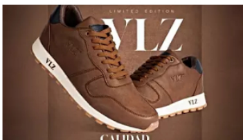
La sofisticación a tus pies: Tenis premium de cuero