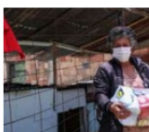
SUBSIDIOS ¿Quién es el encargado de entregar el pago de la Renta Ciudadana?

Etiquetado en: Colombia Petróleo Gas Empresas Gobierno