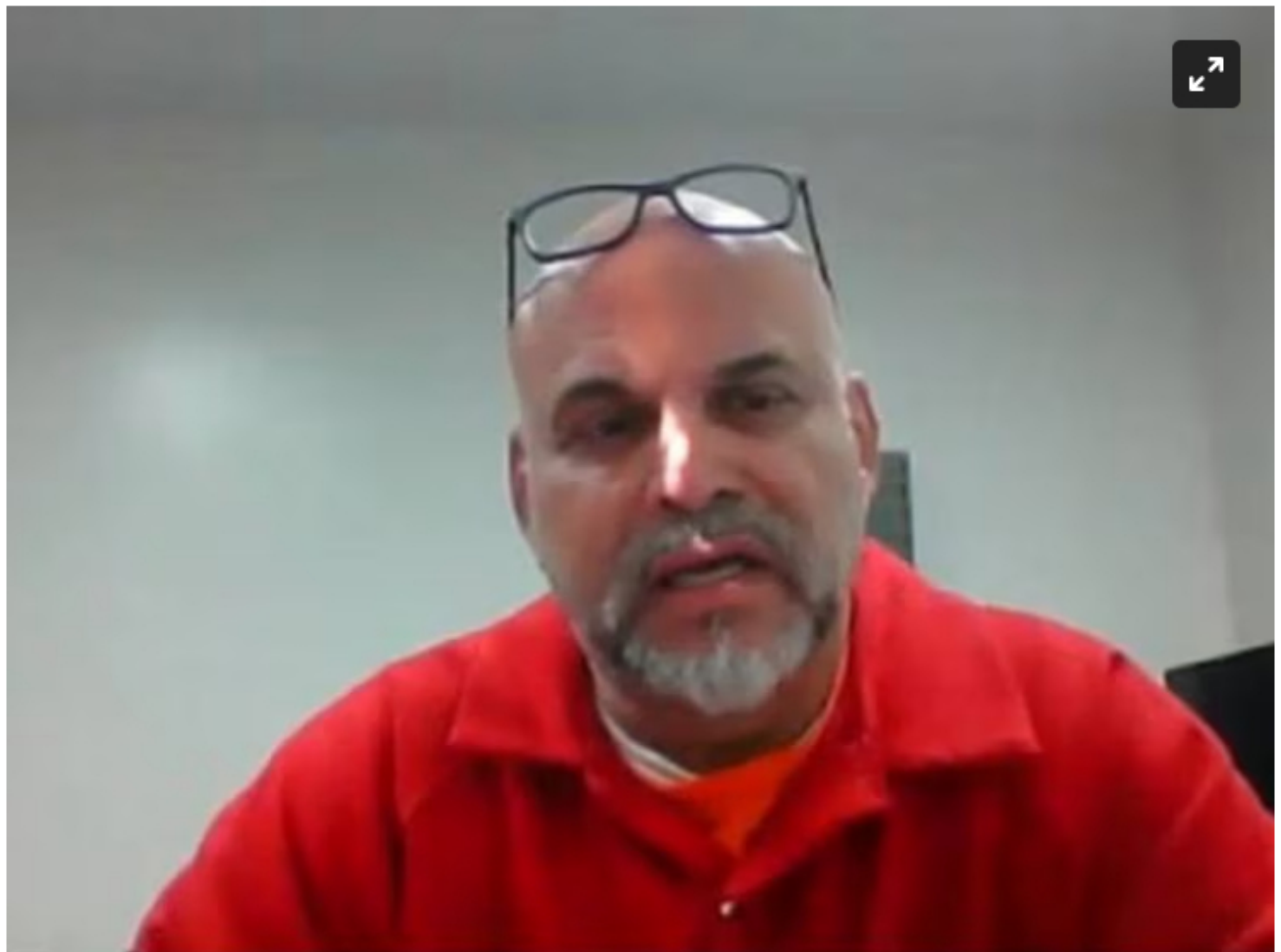
Salvatore Mancuso

Este jueves, 11 de mayo, el exjefe paramilitar seguirá dando EN VIVO su testimonio desde Estados Unidos