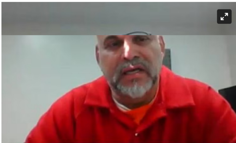
Salvatore Mancuso

Este jueves, 11 de mayo, el exjefe paramilitar seguirá dando EN VIVO su testimonio desde Estados Unidos