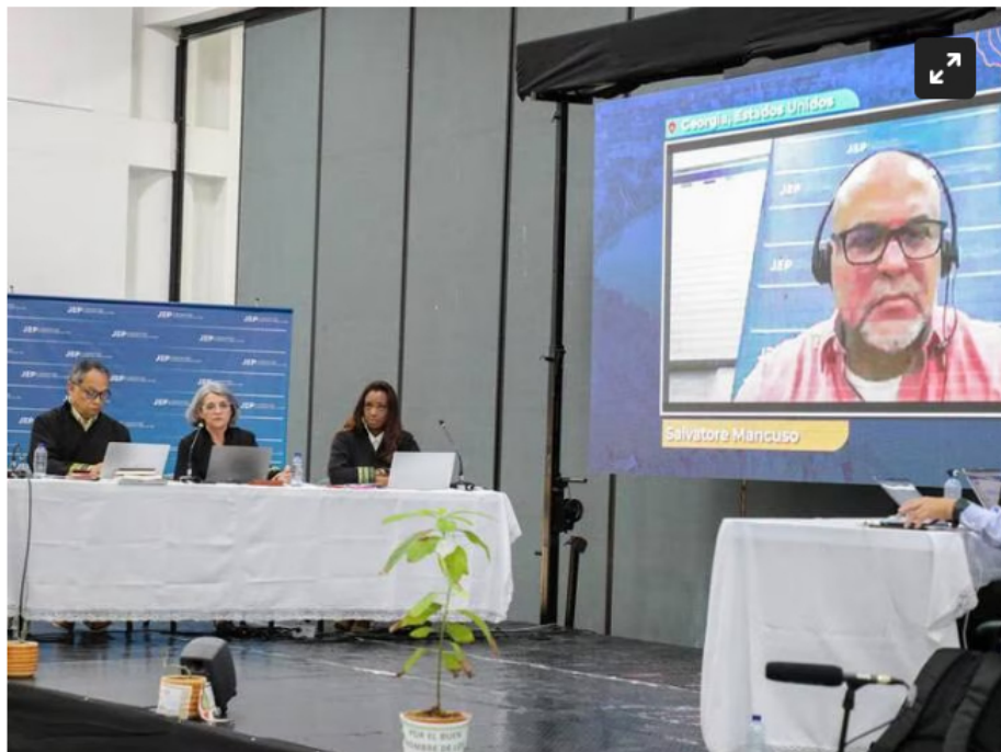
Audiencia de Salvatore Mancuso ante la Jurisdicción Especial para la Paz.

El exjefe paramilitar cumple su segundo día de audiencia de aporte de verdad ante la Jurisdicción Especial para la Paz (JEP)