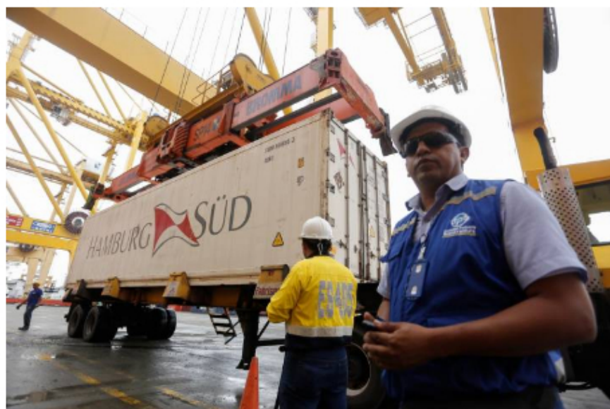
Los departamentos más exportadores fueron Antioquia, Bogotá, Atlántico, Cundinamarca, Bolívar, Valle del Cauca, Huila, Caldas, Casanare, Meta y Santander.

Este 15 de mayo se cumplen 11 años de la entrada en vigencia del acuerdo comercial con el principal socio económico de Colombia. En 2022, café verde, flores frescas, acabados para la construcción, derivados de café y frutas frescas, fueron los sectores que más crecieron en valor en sus ventas externas con este mercado.