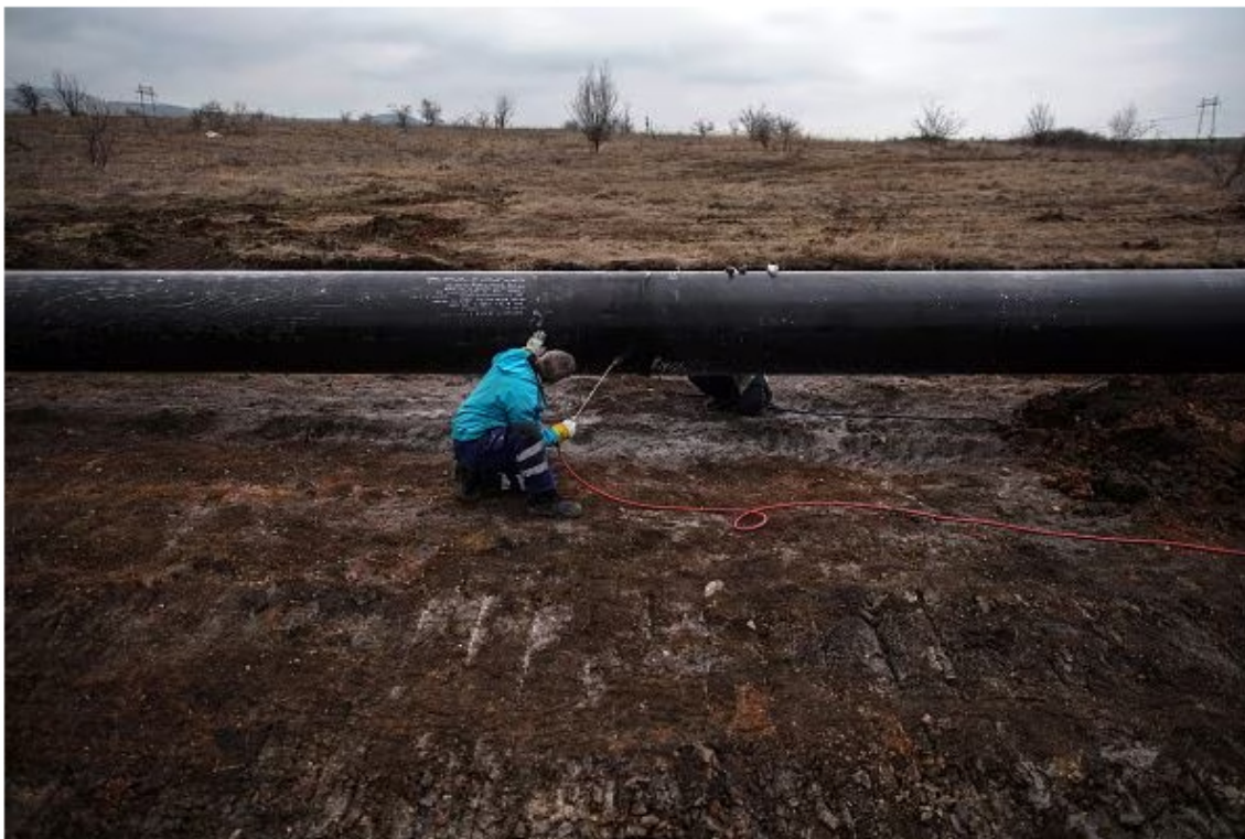
Ecuador también cuenta con el privado Oleoducto de Crudos Pesados (OCP), para 450.000 barriles por día y que junto al SOTE conecta los pozos en la Amazonía hasta un puerto en el Pacífico. (Foto referencia)

“Con el propósito de mitigar las afectaciones, debido a esta fuga de combustible, EP Petroecuador suspendió de manera temporal las operaciones del SOTE. Cabe recalcar que esta medida no afecta las exportaciones, pues hay suficiente crudo en los tanques de almacenamiento”, enfatizó la empresa.