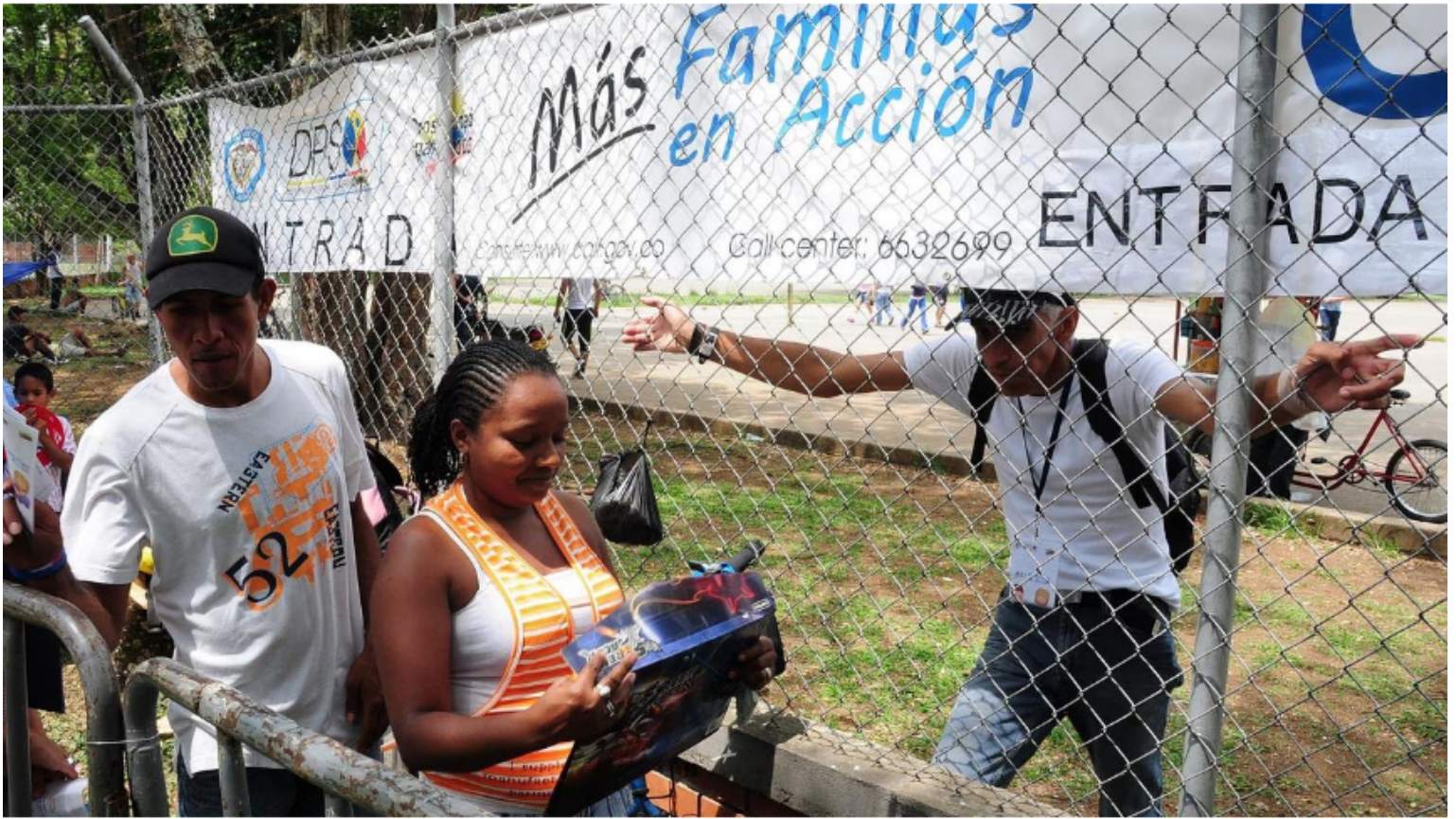
Familias en Acción y Colombia Mayor serían los programas que estarían involucrados en el escándalo