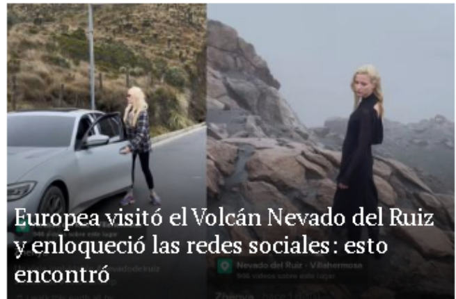
Europea visitó el Volcán Nevado del Ruiz y enloqueció las redes sociales: esto encontró