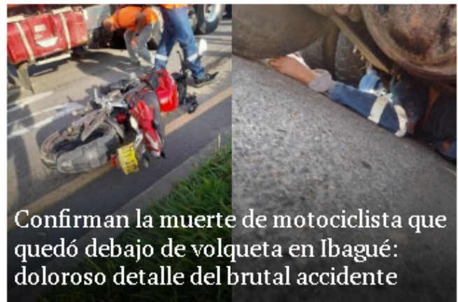
Confirman la muerte de motociclista que quedó debajo de volqueta en Ibagué: doloroso detalle del brutal accidente