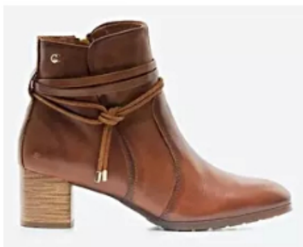
Botín Casual Mujer Pikolinos BCAL Caramelo