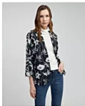
¡Es hora de renovar!