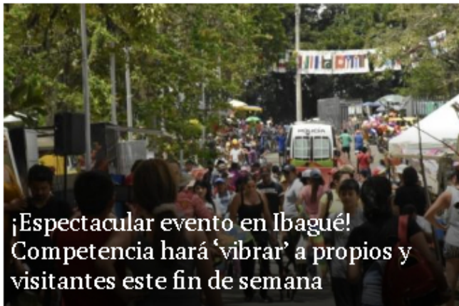
¡Espectacular evento en Ibagué! Competencia hará 'vibrar' a propios y visitantes este fin de semana