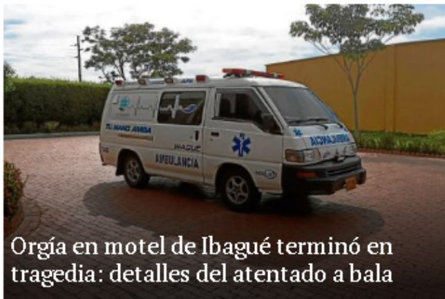
Orgía en motel de Ibagué terminó en tragedia: detalles del atentado a bala