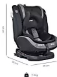
Ofertas en Falabella.com