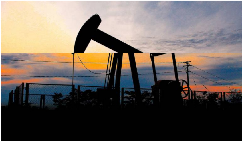
El precio de la acción de Ecopetrol en la bolsa de Colombia ha oscilado hoy entre $2.065 y $2.100.

Si bien el desempeño operacional fue destacable, la utilidad neta se vio impactada por el incremento en los impuestos tras la reforma tributaria.