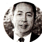
Ricardo Roa Presidente de Ecopetrol

Además, el informe calcula que las reservas cayeron en 2022 hasta 3,14 terapies cúbicos (TPC) y para este año se ubicarán en 3,93 TPC, pero sucede algo similar al caso del petróleo, que los hallazgos aportarán un escaso valor al crecimiento de las reser-