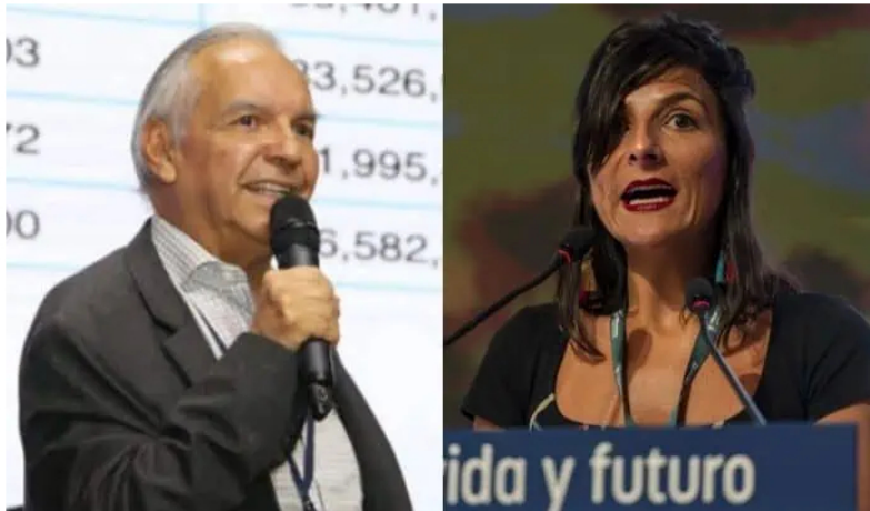
Los ministros Ricardo Bonilla e Irene Vélez han chocado por la posibilidad de cambiar la fórmula de la gasolina en Colombia.

En una entrevista con W Radio, el ministro de Hacienda de Colombia, Ricardo Bonilla, le envió un mensaje a su colega de Minas y Energía, Irene Vélez.