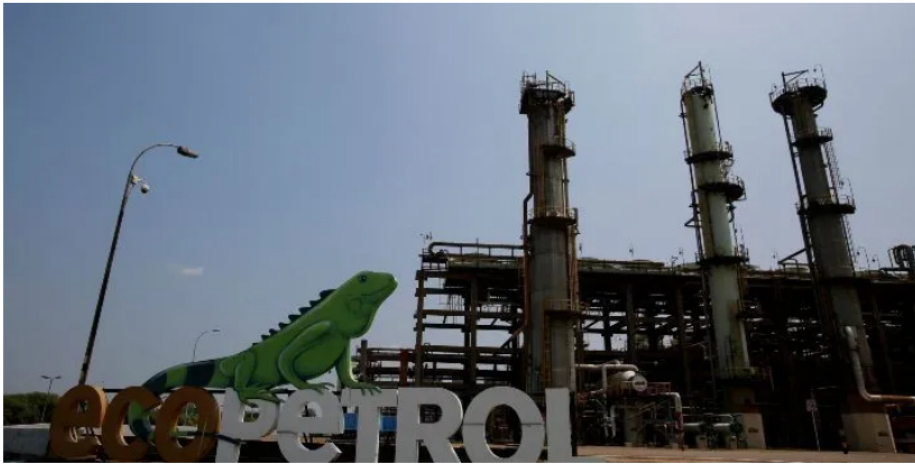
Sede de Ecopetrol en Barrancabermeja, Santander.

En cuanto a producción, Ecopetrol alcanzó un promedio de 719.4 barriles de petróleo equivalente por día (kbped), aumentando 27.3 kbped frente al primer trimestre de 2022.