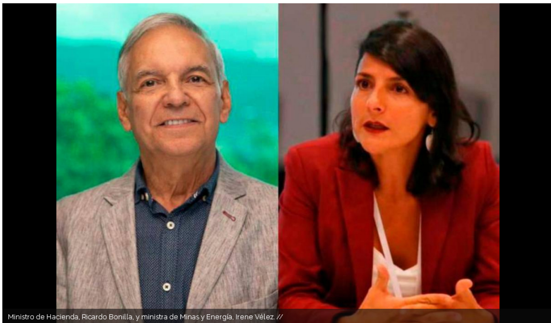
Ministro de Hacienda, Ricardo Bonilla, y ministra de Minas y Energía, Irene Vélez. //

Al ministro de Hacienda, Ricardo Bonilla, no le sonó la propuesta de la ministra de Minas, Irene Vélez, pues le pidió revalorarla.