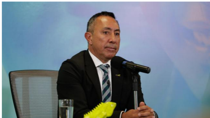
Presidente de Ecopetrol , Ricardo Roa.

De acuerdo con la petrolera, estas cifras son el resultado del fortalecimiento del precio del Brent convertido a pesos colombianos dado el aumento del dólar; la fortaleza operativa en la línea de hidrocarburos con mayores volúmenes producidos y transportados; una mayor capacidad de carga de la Refinería de Cartagena; y el destacado desempeño del segmento de transmisión y vías.