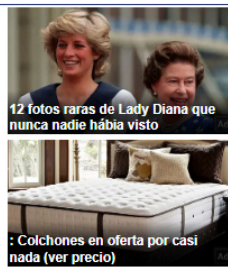
12 fotos raras de Lady Diana que nunca nadie había visto