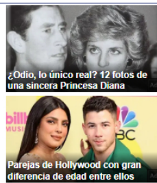
¿Odio, lo único real? 12 fotos de una sincera Princesa Diana