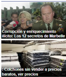
Corrupción y enriquecimiento ilícito: Los 12 secretos de Marbella